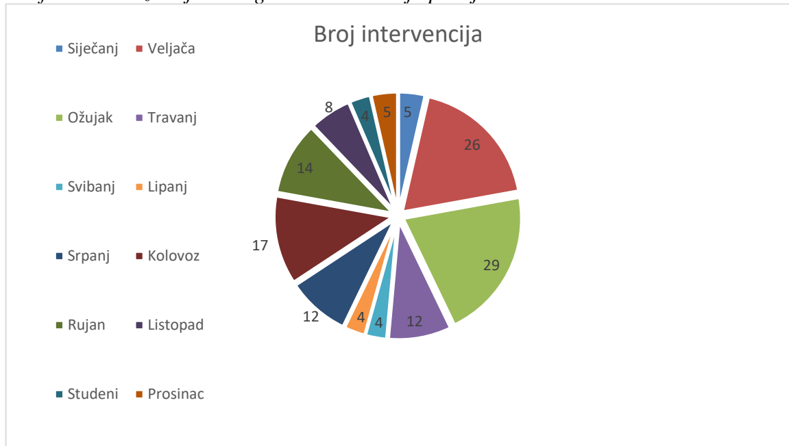
Graf 3. - Prikaz broja vatrogasnih intervencija po mjesecima

Na grafikonu iznad, Graf 3. prikazan je broj intervencija u 2021. godini u požarnom području po mjesecima.