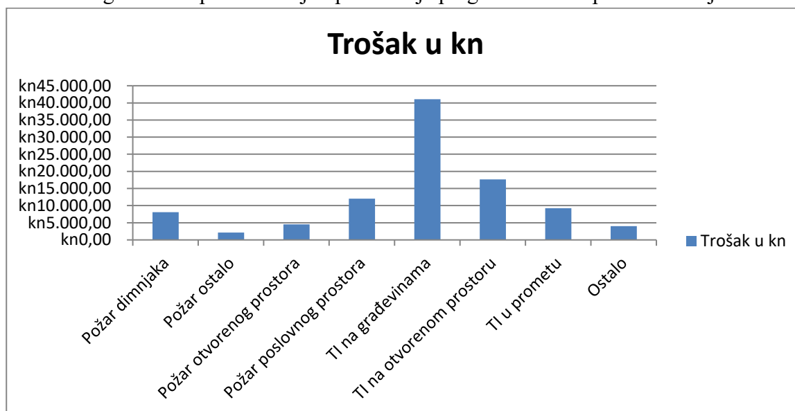
Graf 2. - Prikaz pregleda troškova po intervencijama

Na grafičkom prikazu broj 2. prikazan je pregled troškova po intervencijama.