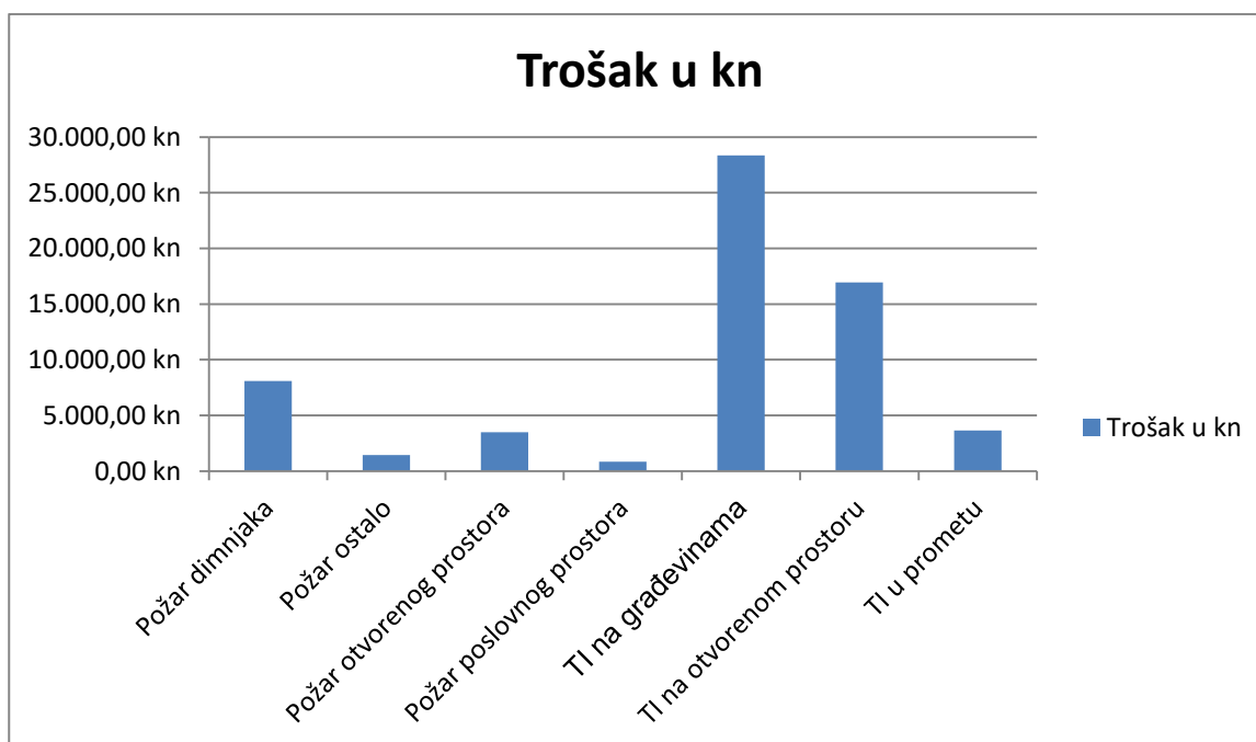
Graf 2. - Prikaz pregleda troškova po intervencijama

Na grafičkom prikazu broj 2. prikazan je pregled troškova po intervencijama.